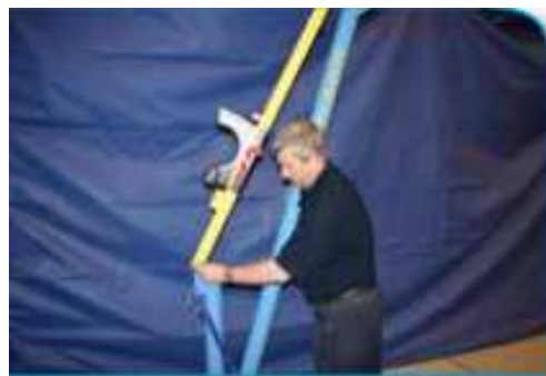
ウィンチビームの差し込み