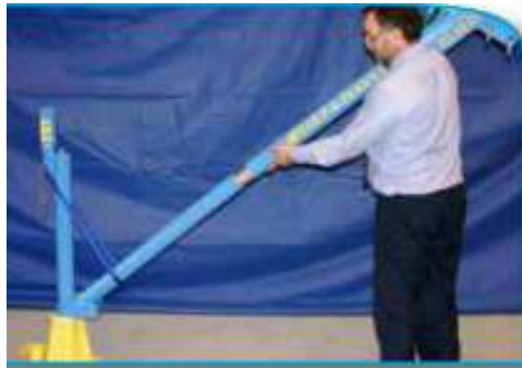
ブームの差し込み